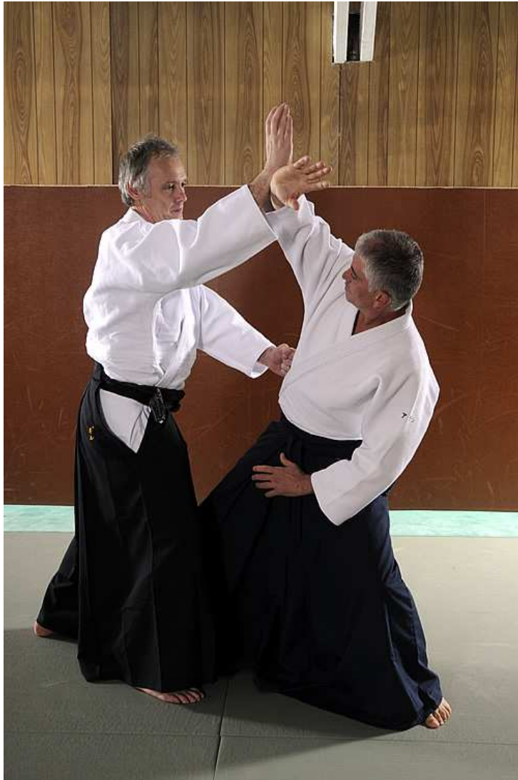
L'auteur tentant de mettre ses pas dans les pas du Fondateur (Uke : Alain Ipekdjian – Vincennes 2008)